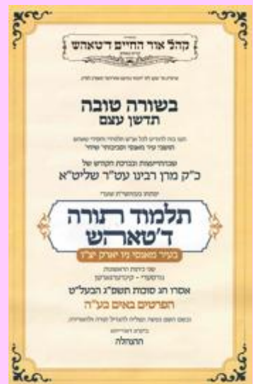
די ערשטע מעלדונג איבער די עפענונג פונעם חדר

צוביסלעך האבן זיך די מוסדות צו וואקסן מיט זייער אייגענע מענטשן אז עס איז געווארן שווער צו אריין נעמען קינדער פון אנדערע קהלות, און עס האט אויסגעפעלט איינמאל פאר אלעמאל צו עפענען אייגענע מוסדות ווי מען וועט קענען שיקן די קינדער און זיין רואיג אז זיי באקומען די זעלבע חינוך וואס מיר האבן באקומען פון אונזערע עלטערן. און טאקע בשעה טובה איז געמאלדן געווארן די ברעכענדע נייעס אז מיט'ן אייבערשט'ס הילף וועט מען צום נייעם לערן יאר פון שנת תשפ"ג עפענען די טויערן פון אן אייגענע תלמוד תורה עבודת משולם פייש טאהש אין שטאט מאנסי. יעדער געדענקט נאך די גרויסע שמחה וואס האט געהערשט צווישן אנשי שלומינו די בכל אתר ואתר ובפרט ביי אונז תושבי מאנסי וואס לעכצן שוין די לעצטע צענדליגער יארן צו האבן אן אייגענע מקום די קינדער זאלן וואקסן און שטייגן מעלה מעלה בתור"ש אויפ'ן הייליגן דרך וואס מיר האבן מקבל געוועהן פון רבינו הקדוש און ווי עס פירט אונז ווייטער כ"ק מרן אדמו"ר שליט"א און יעצט אצינד איז די הלום ערפילט געווארן ווען מען גייט בעזר השם יתברך עפענען אן אייגענע חדר דא אין שטאט. די שמחה איז ממש געוועהן אין לשער ביי אלע אנשי שלומינו היקרים פון דא אין מאנסי.